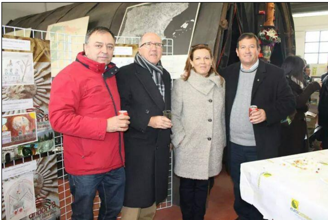
Figura 2: Miembros de la Asociación Cultural Pozo San Juan.