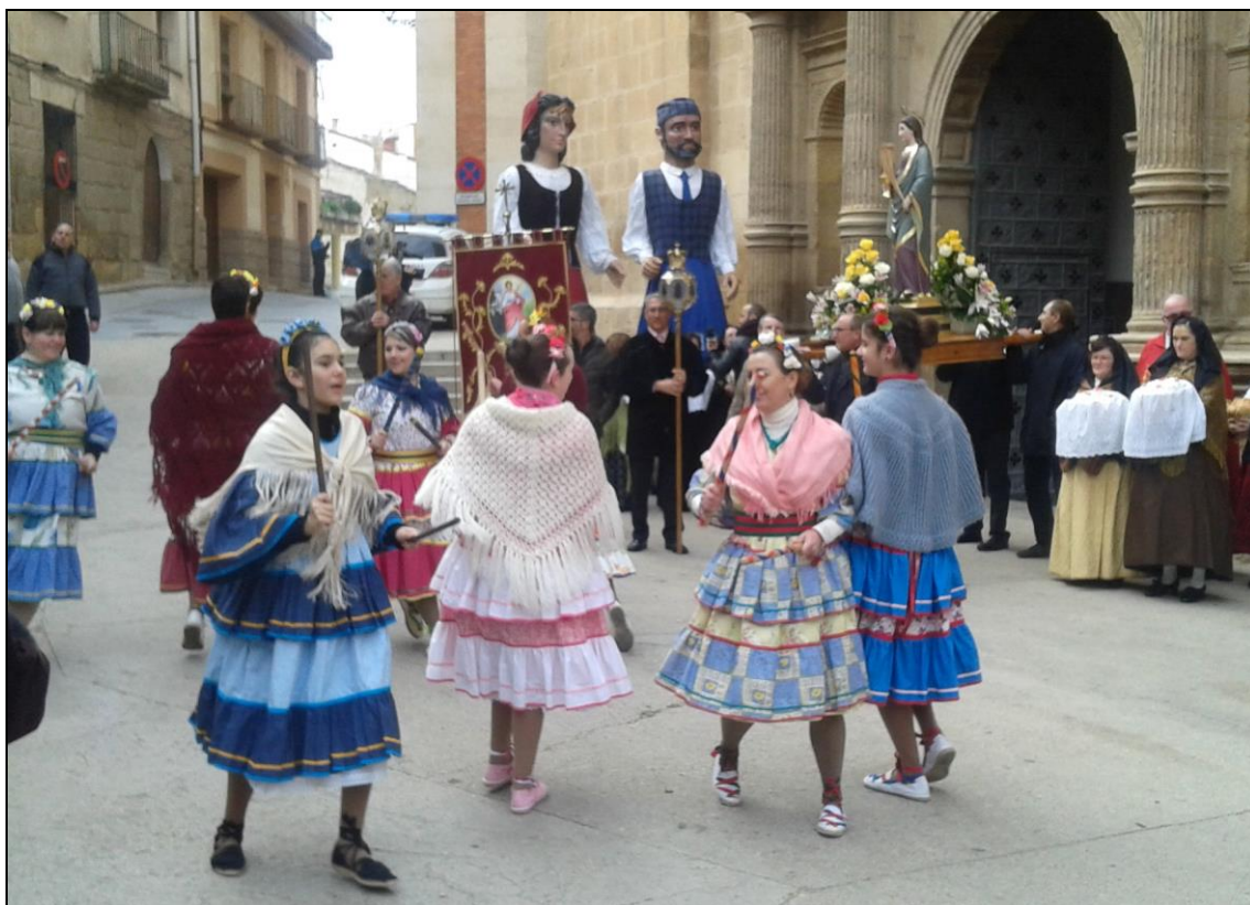
Figura 8: Baile final al terminar la procesión.

Finalizada la Misa, se realiza la procesión por las calles de la villa minera, participando en ella diversos grupos, que aportan una visión folklórica y festiva a la citada celebración. Abren la misma los cabezudos Macario y Bárbara, caminando tras ellos el Grupo de Dance Santa Bárbara de Andorra, amenizando con bailes en todo el recorrido al son del Grupo de Dulzaineros la Martingala. Desfilan a continuación un nutrido grupo de señoras engalanadas con trajes regionales, acompañadas por miembros de la Cofradía de Santa Bárbara, y tras estos, la imagen de la Santa portada a hombros, cerrándose la comitiva con la autoridad eclesiástica, a la que acompañan un número importante de ex mineros y simpatizantes. Todos los participantes conforman, en definitiva, un grupo variado y colorista, que con mucho respeto y seriedad efectúan un trabajo singular que impide que tan notable tradición no caiga en el olvido (Figs. 4, 5, 6, 7 y 8).