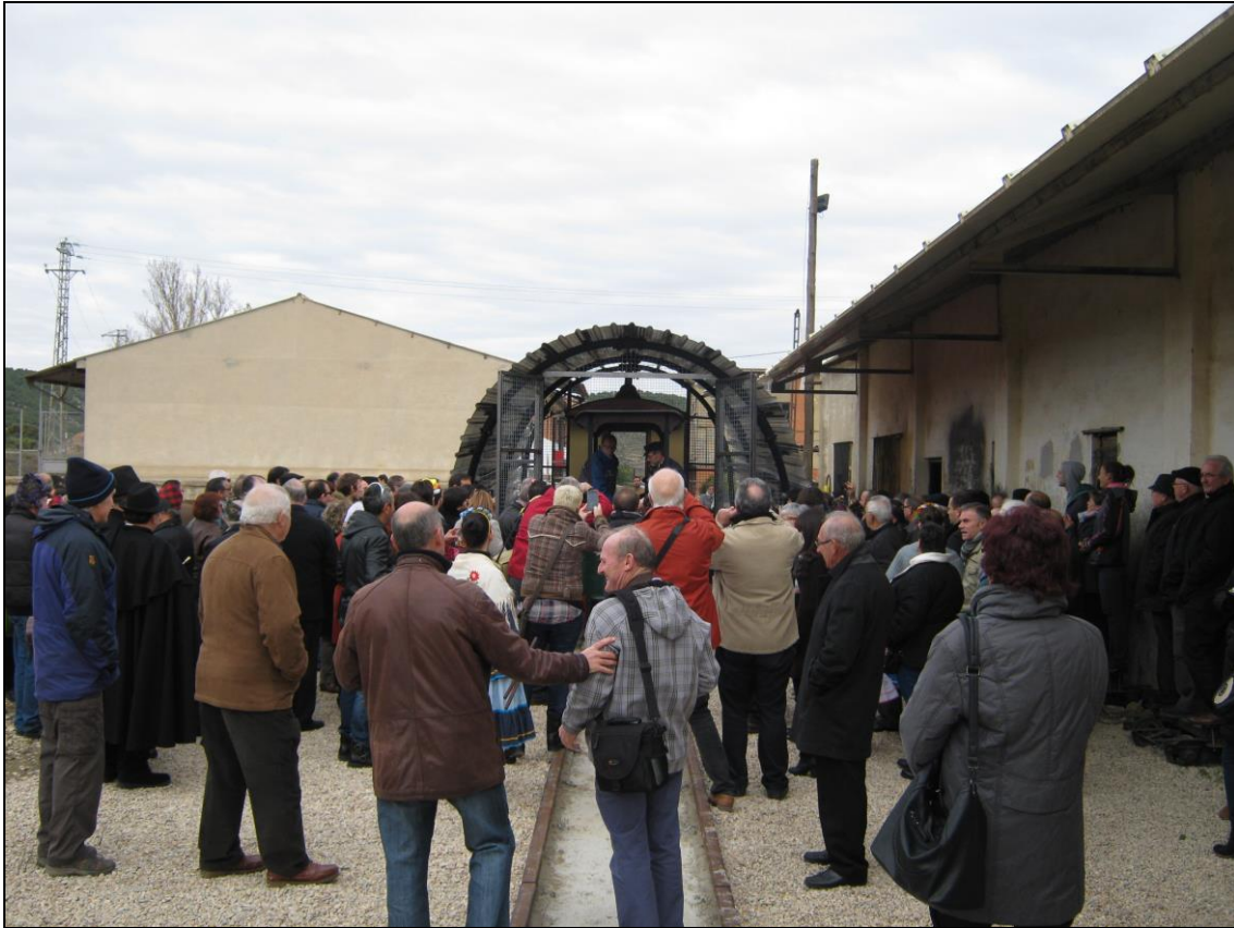
Figura 14: Expectación ante la puesta en marcha de La Locomotora.