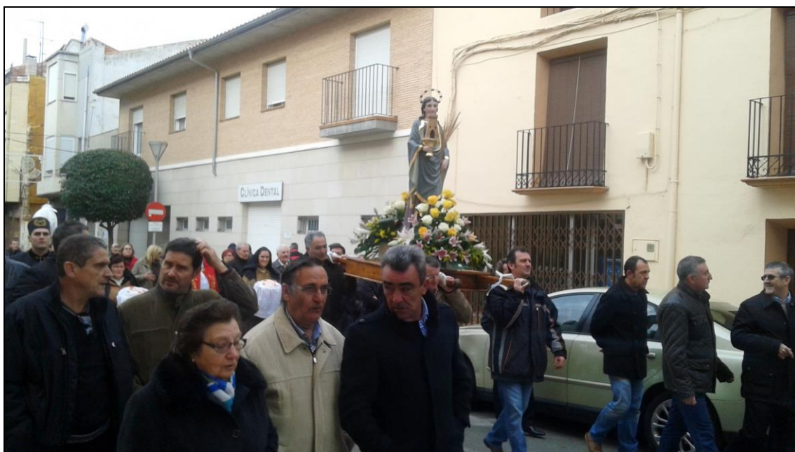
Figura 7: Un momento de la procesión

Los actos se inician con la celebración de una Misa en honor a Santa Bárbara, cuya imagen preside la misma desde el altar, en la Iglesia Parroquial. La eucaristía se acompaña con cantos interpretados por el Grupo de Jota del Hogar del Jubilado, cuyos integrantes todos mantuvieron algún vínculo con la mina, bien de forma directa o indirecta.