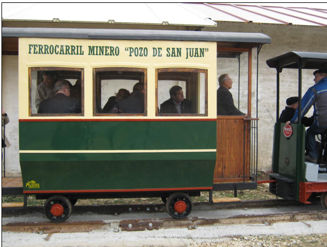
Figura 19: Vagón completo con los primeros viajeros.

año 2016 cumplirá cien años de servicio, fue adquirida a un coleccionista ferroviario quien previamente la había rescatado en un desguace, tras haber prestado servicio en las obras de ampliación de los puertos de Castellón y Gijón (Figs. 17 a 21).