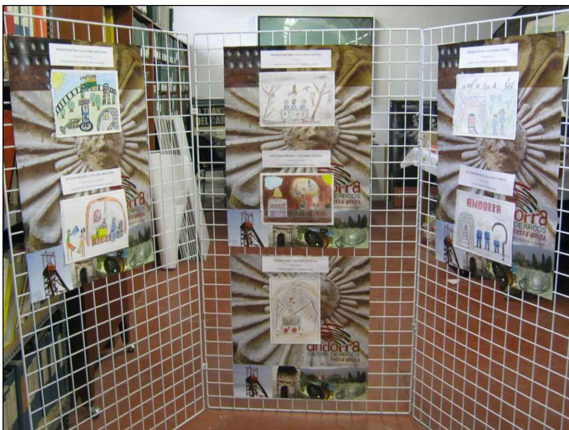
Figura 3: Trabajos premiados en el IX Concurso de Dibujo.

Esta disminución de actividad y por extensión de mineros, no es óbice para que la festividad patronal se siga celebrando con mucho rigor y esmero desde la Comarca Andorra Sierra de Arcos, la Asociación Cultural Pozo San Juan, la