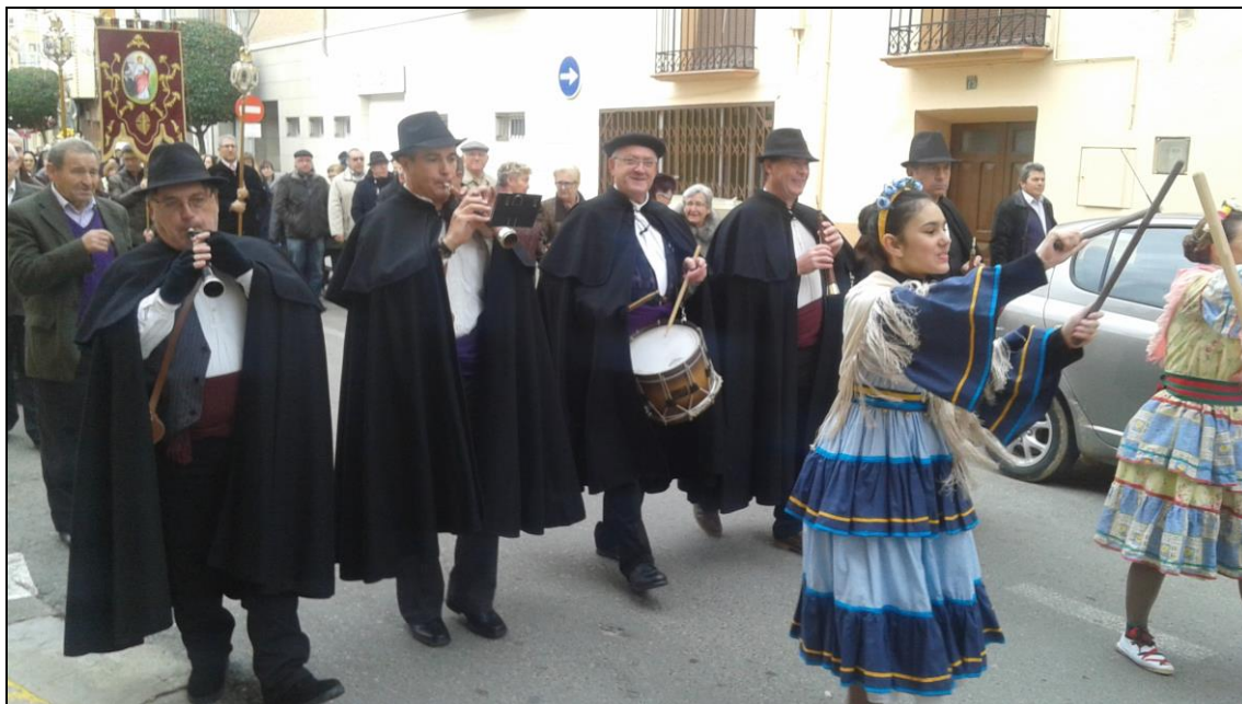
Figura 6: Grupo de Dulzaineros La Martingala.

inmaterial, en el que se integran las tradiciones, las costumbres y los elementos folklóricos que se generan en los pueblos mineros y que son fundamentales para entender el devenir de estas sociedades. Además, estas acciones sirven de complemento importante a los trabajos que se vienen realizando desde hace 9 años en la recuperación del patrimonio material.