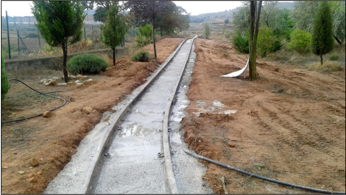
Figura 17: Figura 2: Imagen de una parte del trazado construido.