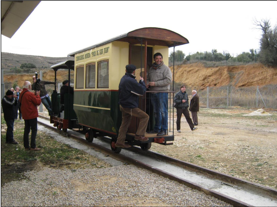
Figura 21: Vuelta a cochera. Fin del viaje