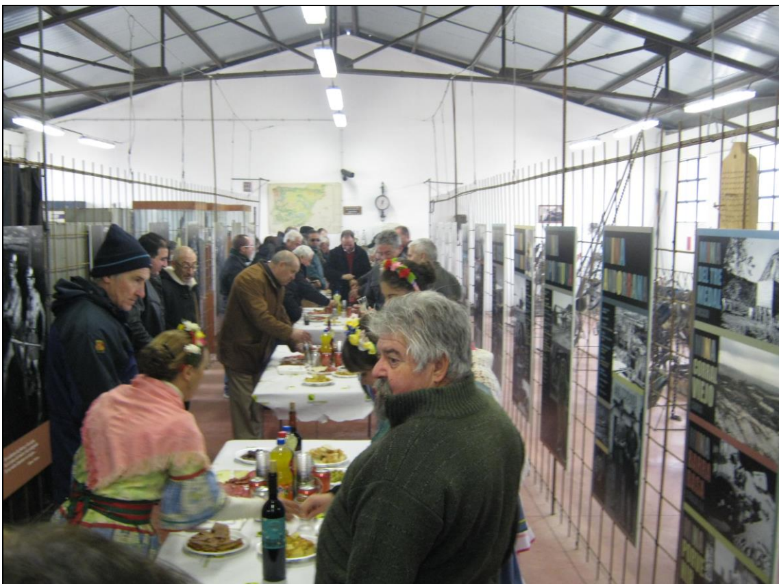
Figura 22: Fin de celebraciones, "vino aragonés".