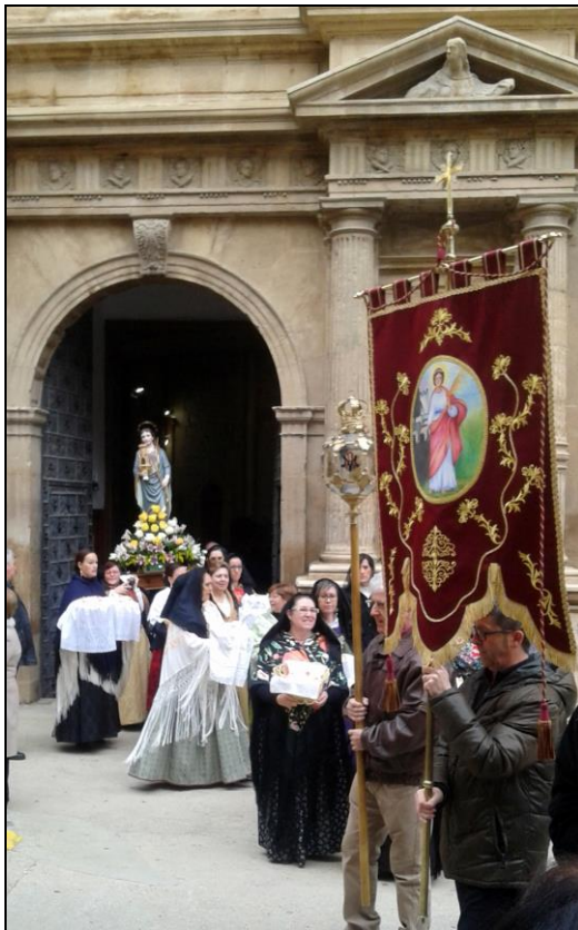
Figura 4: Salida de la iglesia de la imagen de Santa Bárbara para realizar la procesión. En primer plano el estandarte de la Cofradía.

Otra de las actividades realizadas y que ocupa un lugar destacado en el conjunto de las mismas es el Concurso Infantil de Dibujo (Fig. 3), que ya va por su IX edición, con una participación en aumento cada año, habiéndose alcanzado en esta última un número de participantes próximo al medio centenar.