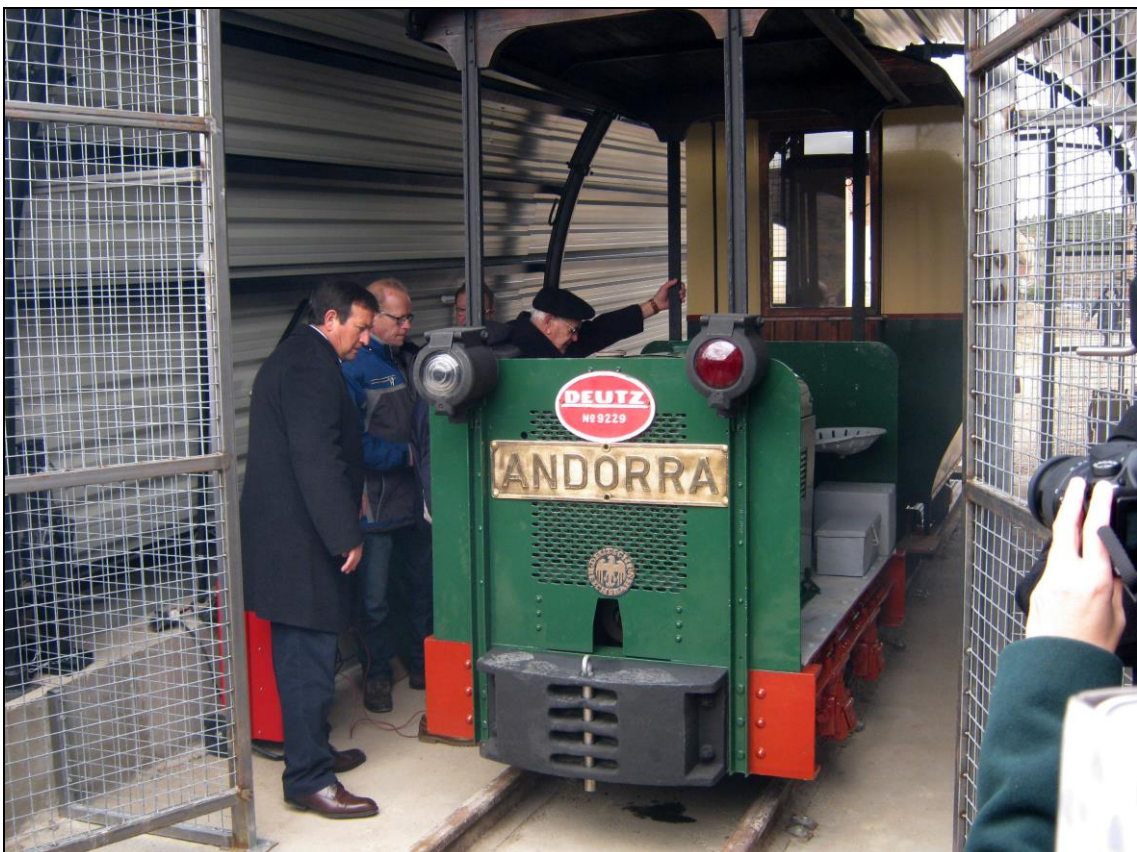
Figura 13: Preparativos para puesta en marcha de Locomotora Deutz 9229.