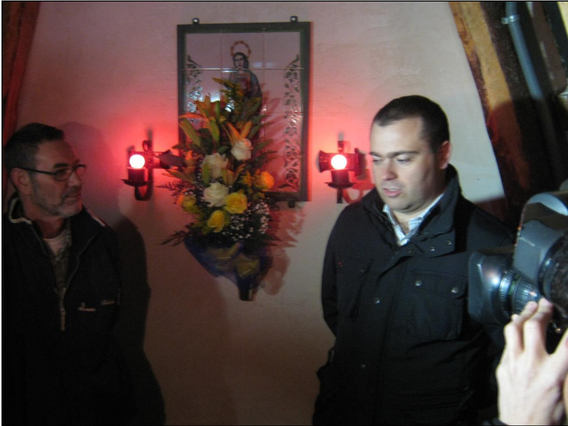
Figura 12: Peticiones a la patrona.