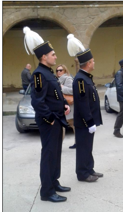
Figura 5: Mineros polacos con sus uniformes de gala

El día 4 de diciembre, día de Santa Bárbara, es, sin duda alguna, el epicentro de todas las celebraciones. Esta festividad, que había ido perdiendo fuelle, ha tomado en estos últimos años auge muy relevante, encontrándonos en la actualidad en plena fase de recuperación y puesta en valor del patrimonio