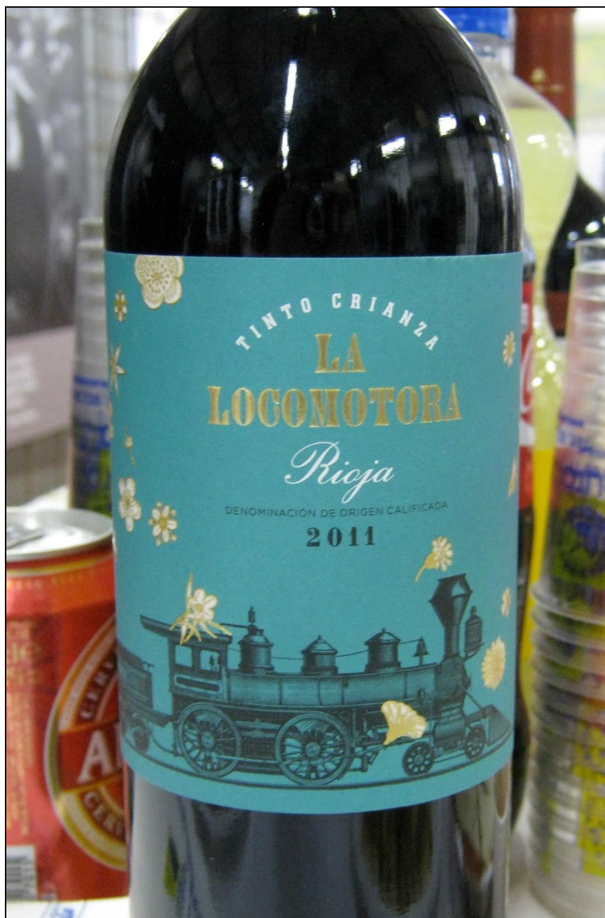
Figura 23: Botella de vino, nombre comercial “La Locomotora”.

Como fin de fiesta, se invitó a los asistentes a un vino “aragonés”, en el que para conmemorar tan importante acontecimiento, se degustó, por gentileza de un comerciante de la zona, un rioja llamado "La Locomotora" (Figs. 22 y 23).