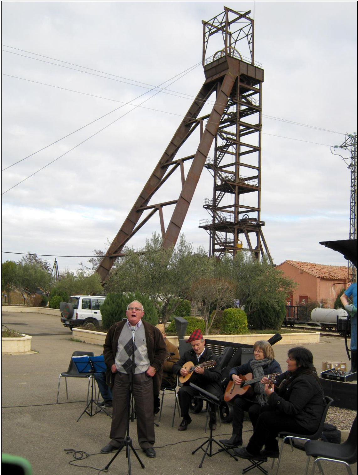
Figura 9: Cantos populares