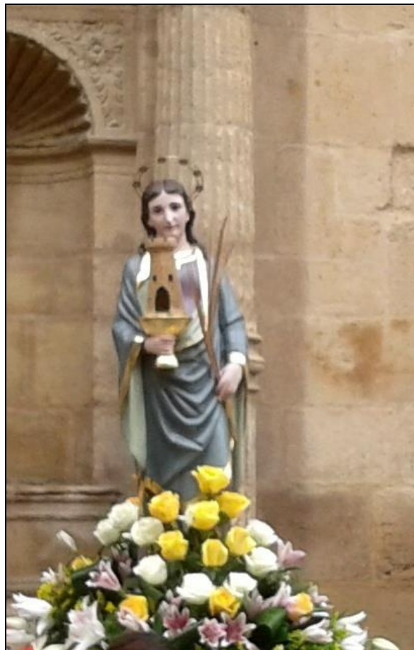
Figura 1: Imagen de Santa Bárbara, que es custodiada por la Cofradía en Andorra.

Un año más, se ha celebrado en esta villa minera aragonesa la festividad de Santa Bárbara, patrona de los mineros (Fig. 1), con la realización de un gran número de actividades. Es cierto que la actividad minera, sobre todo la extracción de lignito, está desapareciendo a pasos agigantados; en cambio se reactivan con relativa intensidad los trabajos mineros dirigidos a la extracción de arcillas y caolines en varios puntos de la Comarca de Andorra.