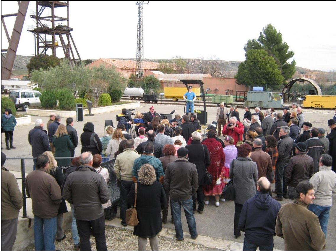
Figura 10: Jotas bajo el castillete