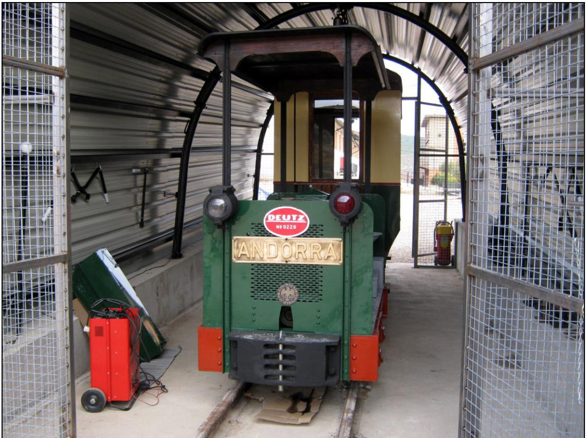
Figura 18: Inicio del recorrido desde la cochera.

Merece señalarse que todos los carriles instalados en el circuito proceden del antiguo trazado del ferrocarril Andorra-Escatrón, fuera de servicio desde 1984, siendo por tanto una vía de gran relevancia histórica, ya que por ella circularon desde su origen, en el Val de Ariño, hasta la Central Térmica de Escatrón, miles de toneladas de carbón que procuraron la energía necesaria para la producción de electricidad. En cambio, la locomotora Deutz nº 9229, que en el