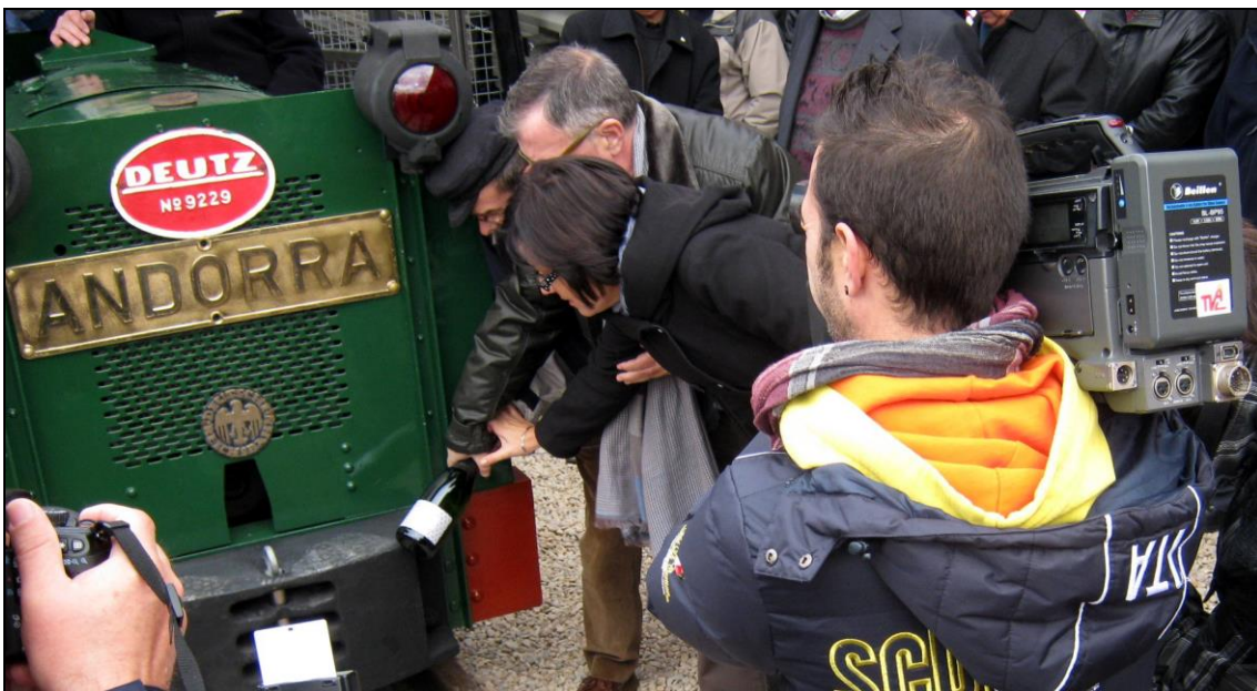
Figura 15: Rotura botella de cava en tope Locomotora.

Como colofón a todos los actos programados, se procedió a la inauguración del nuevo trazado ferroviario que se ha construido este año como última actuación en el Parque Minero, consistente en un recorrido circular de 1,2 Km de longitud, que discurre por todo el entorno del Parque, y la puesta en vía o “botadura sobre raíles” de la locomotora Deutz Nº 9229 (Fig. 13 y 14) y un vagón para transporte de personal. Todos estos elementos ferroviarios, cuidadosamente restaurados por miembros de la Asociación Cultural Pozo San