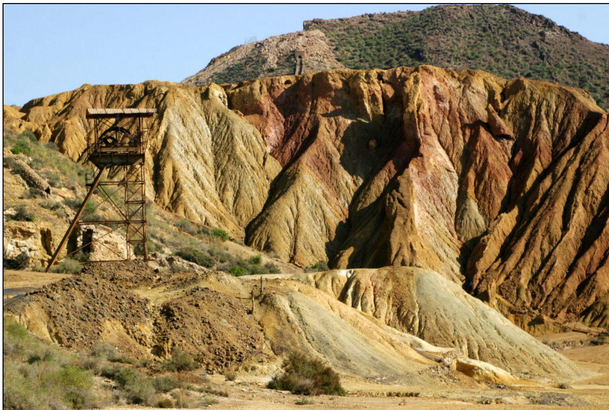
Mina No te escaparás . Mazarrón, Murcia (Fot. JM. Sanchis)

Para finalizar con este apartado, una mina denunciada en Cantabria cuyo nombre lo dice todo: Si se encontrara mineral... Probablemente, sí se encontró, a juzgar por la zona dónde estuvo enclavada dicha concesión. Ya lo vaticinaba quien denunció en Teruel la mina Buscando se encuentra , aunque otro, en la localidad de Escucha optó por la cautela y llamó a su mina Se verá . Allí sigue, convertida en mina visitable, muy próxima a otra llamada Aún hay caso .