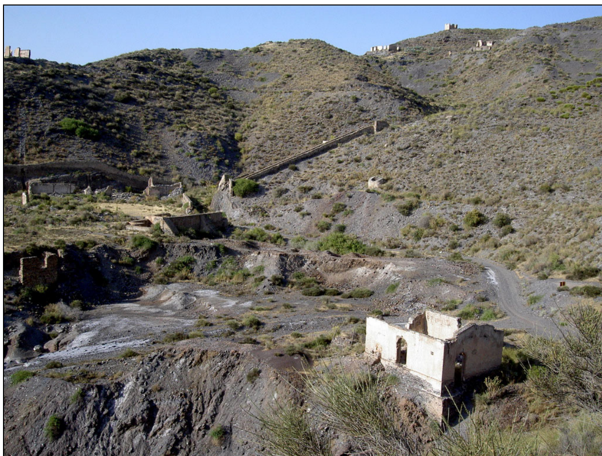
Mina Crescencia. Cuevas del Almanzora, Almería

Muy recurridos fueron también los nombres propios femeninos, por delante de los masculinos, para dar título a la mina. Esposas, madres, hijas o posiblemente incluso amantes (encontramos una llamada Mi querida ) sirvieron para bautizar a aquellas denuncias, figurando desde los nombres más habituales entre las féminas, tales como Alicia , Irene , Josefina , Isabel , María , Pilar , Teresa , Rosa , Aurora , Pepita , Blanca , Esperanza , Amparo , Antoñita , Laura , Dolores , Elvira , Mercedes , Amalia , Mary , Antonia o Luisa , a otros no tan usuales, como pueden ser Benedicta , Diana , Felisa , Marina , Raimunda , Telesfora , Baltasara , Delfina , Filomena , Genoveva , Jeroma , Crescencia , Berenguela , Tomasa , o Jacinta . En algunos casos, el nombre venía acompañado de epíteto, como por ejemplo, la tarraconense Linda Mariquita .