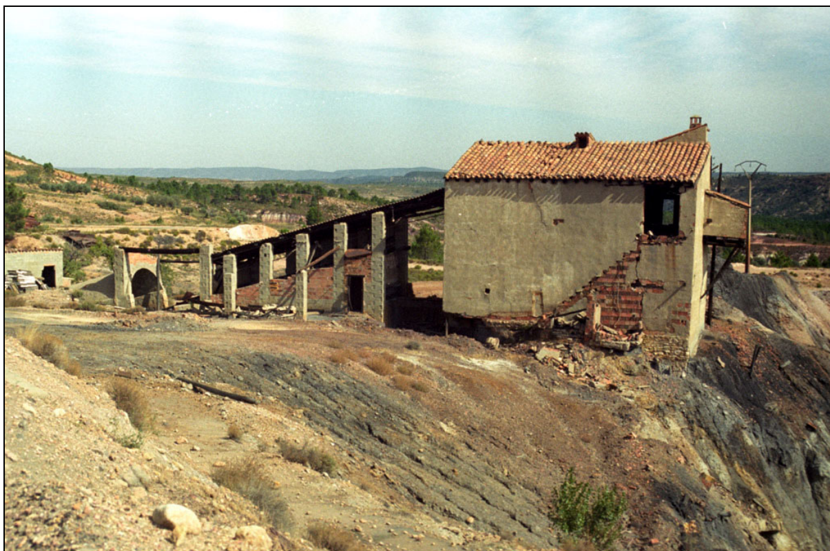
Mina Elvira . Estercuel, Teruel