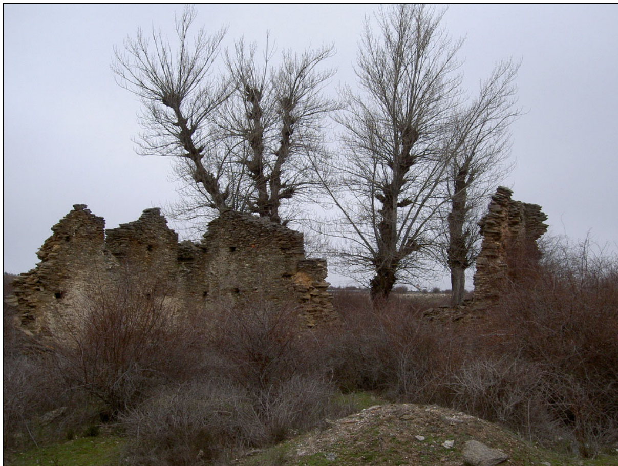
Mina La Verdad de los Artistas . Hiendelaencina, Guadalajara