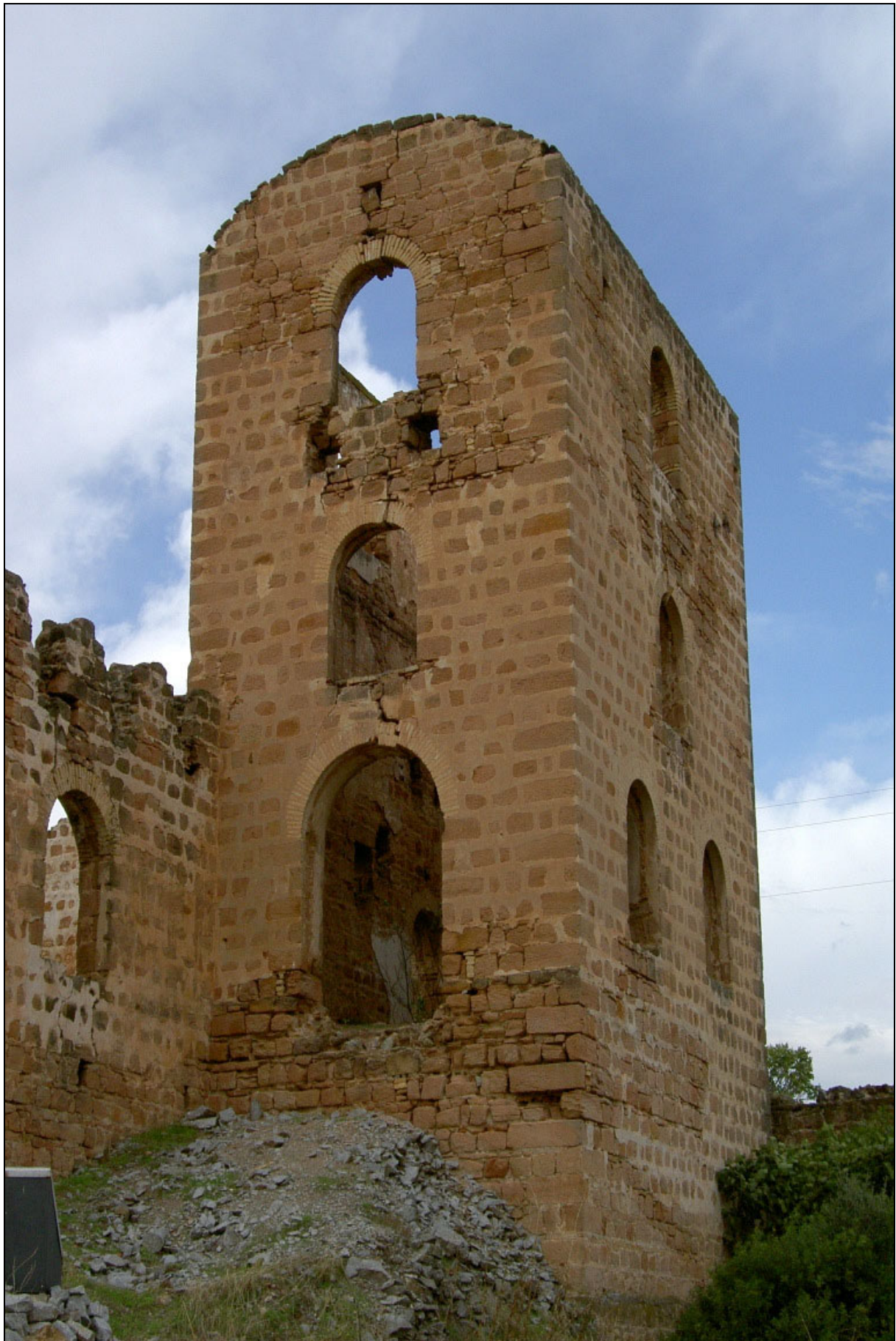
Pozo Santa Annie . Linares. Jaén