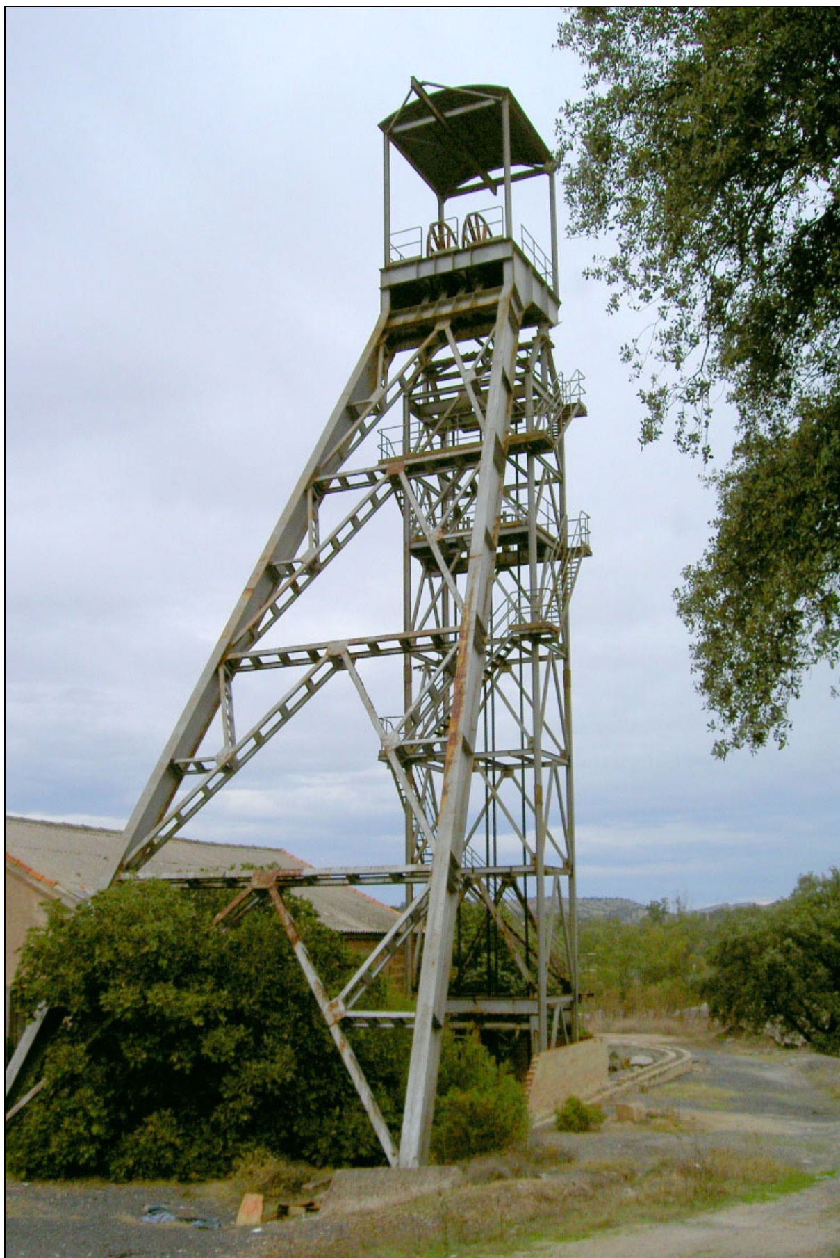
Pozo Esmeralda . Bailén, Jaén