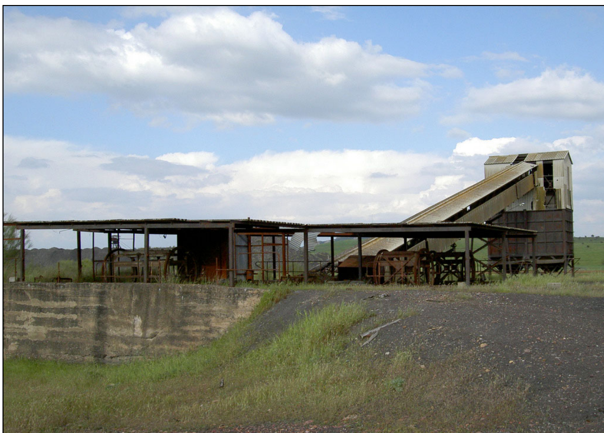
Mina Cervantes . Fuente-Obejuna, Córdoba