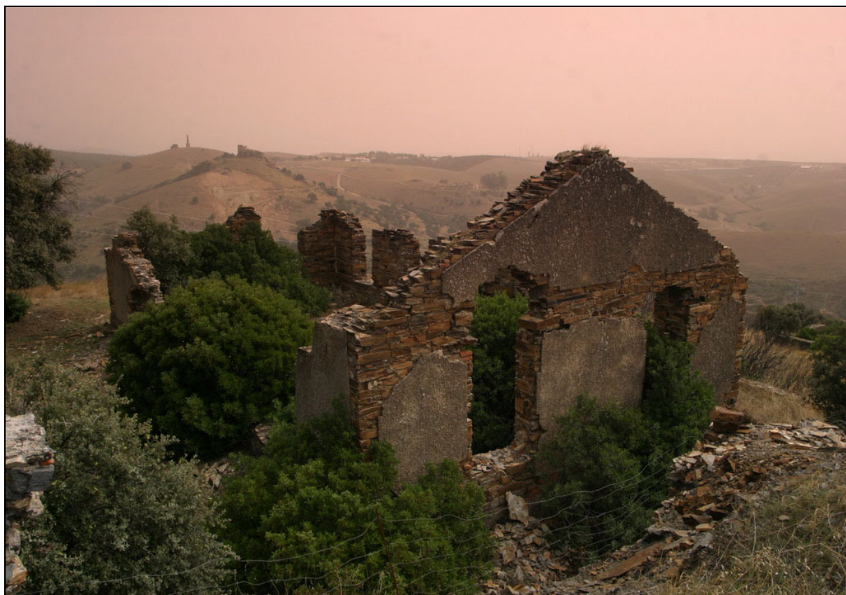
Mina El Sinapismo . La Carolina, Jaén

No olvidamos tampoco dar un repaso a la infinidad de explotaciones registradas en el distrito de Linares-La Carolina, con nombres tan insólitos como Ampliación a El Bicarbonato, El avestruz, El Califa que no muere, La parálitica, La Sevitaña Magañeja, Los Monfíes de las Alpujarras. Txori Mendi, El macho y la cabra, El Porvenir Oscuro, La Constancia de los amigos de Reding, El Sinapismo o Minas de Tonkin .