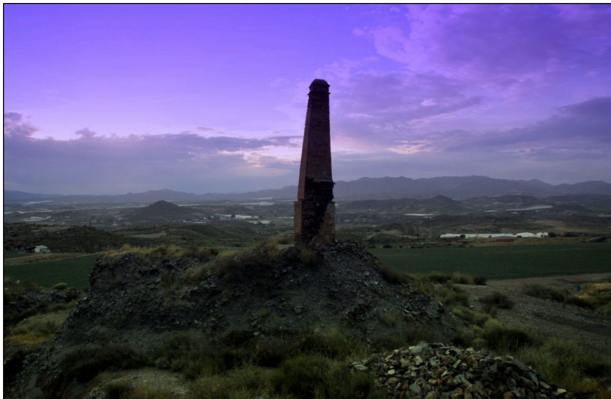
Mina La Tonta (Asunción de Cartagena). Cuevas del Almanzora, Almería

Terrible , siendo muchos los que recogían alguna característica del lugar o la explotación, existiendo también algunos ciertamente despectivos: Apestosa , Disgusto , Dudosa , Extraviada , Equivocada , Pobrecita , Aborrecida , Desastrosa , Malhuele , Despreciada , La sucia , La tonta , Desperdicios o la asturiana Descuidada .