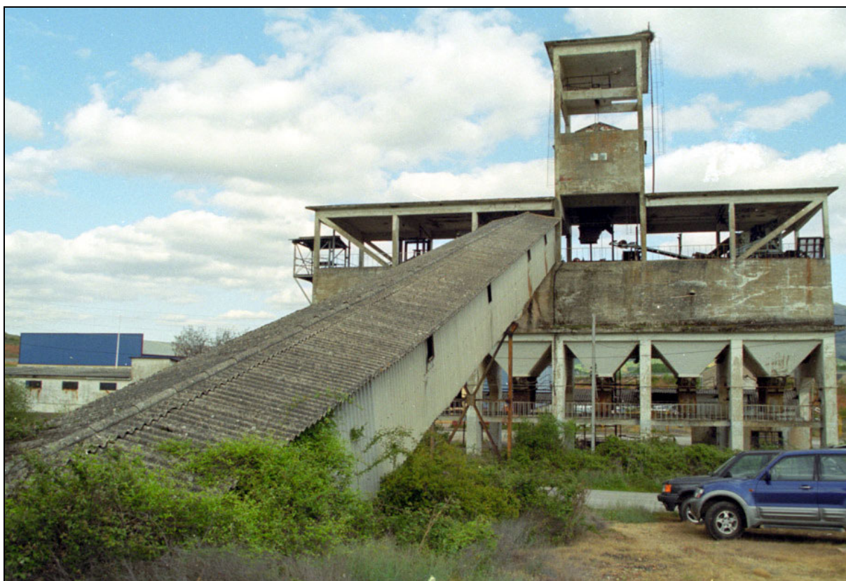
Coto minero Vivaldi . San Miguel de Dueñas, León