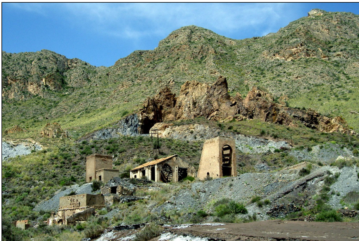
Mina Quien tal pensara . Pulpí, Pilar de Jaravía, Almería