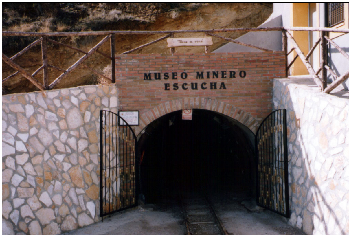
Mina Se verá . Escucha, Teruel