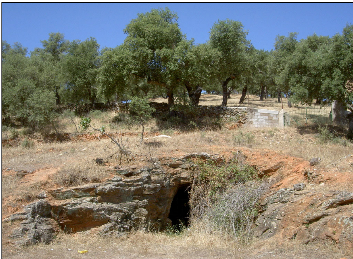
Mina Virgen de Gracia . Oliva de Mérida, Badajoz