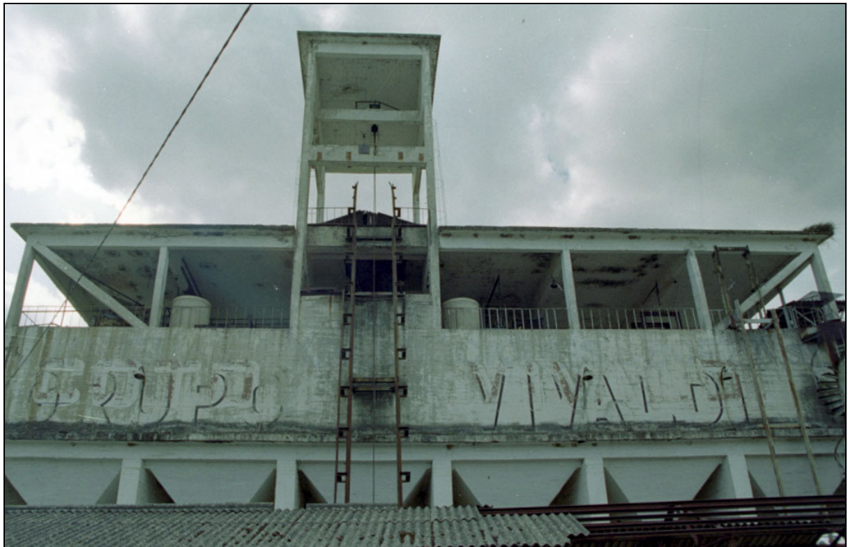
Coto minero Vivaldi . San Miguel de Dueñas, León