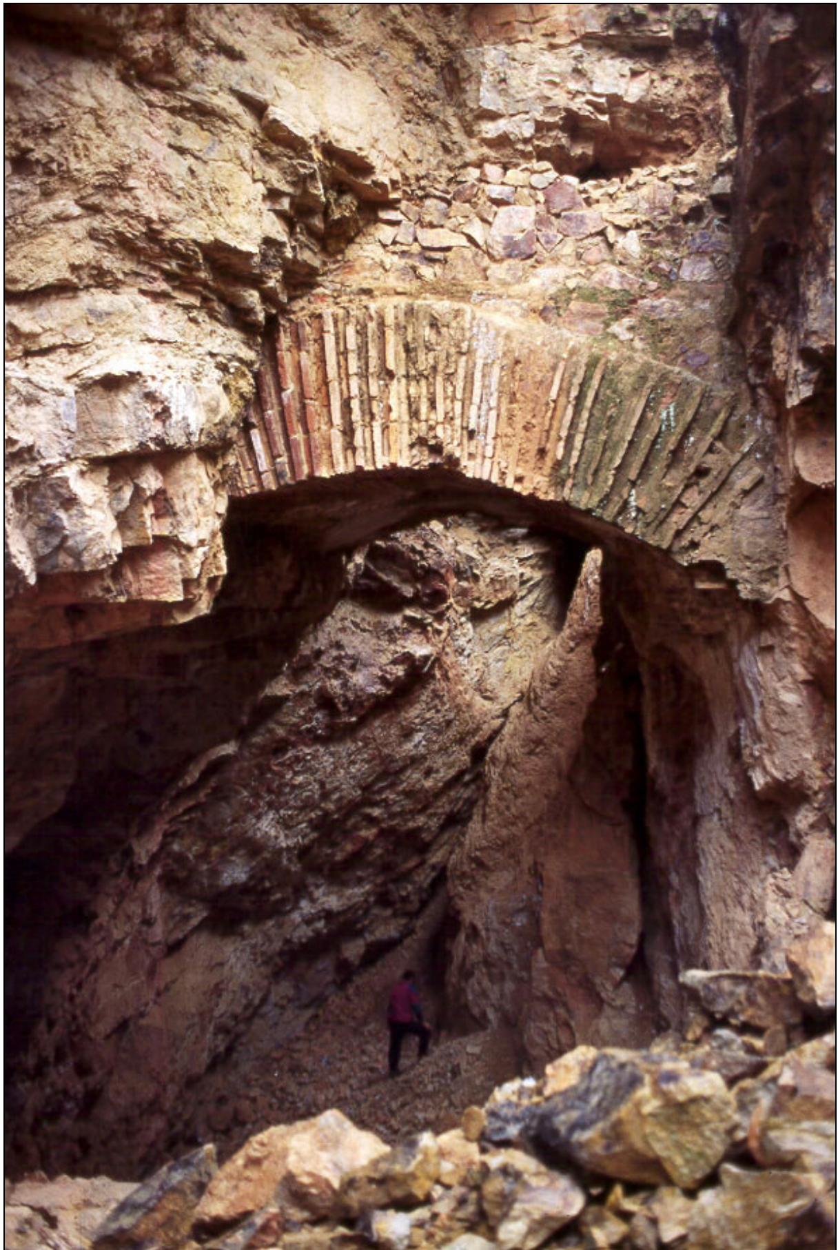
Mina Resuperferolítica . Santa Eufemia, Córdoba