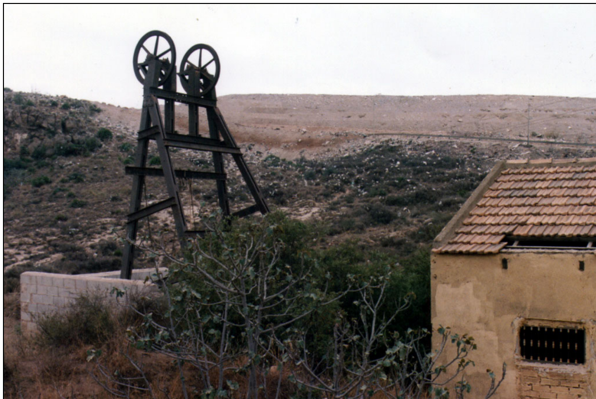
Mina Dios te ampare . El Gorguel, Murcia

Y nunca mejor dicho. Los nombres de santos, santas y vírgenes son, sin duda, a los que más se ha recurrido a la hora de bautizar a las minas. Acogerse a la protección de todos ellos parecía ser costumbre arraigada en los registradores de derechos mineros, contándose por miles las explotaciones que los ostentaron, puesto que en muchísimos casos no solamente era necesaria la tutela del santo o santa elegida, sino de toda la corte celestial para sacar adelante aquellos arriesgados proyectos, que tanto tenían de aventura.