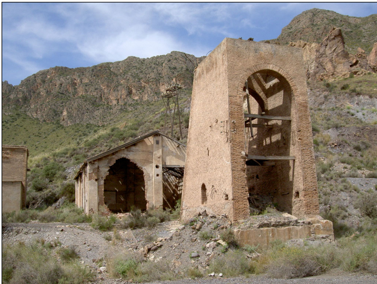
Mina Quien tal pensara . Pulpí, Pilar de Jaravía, Almería