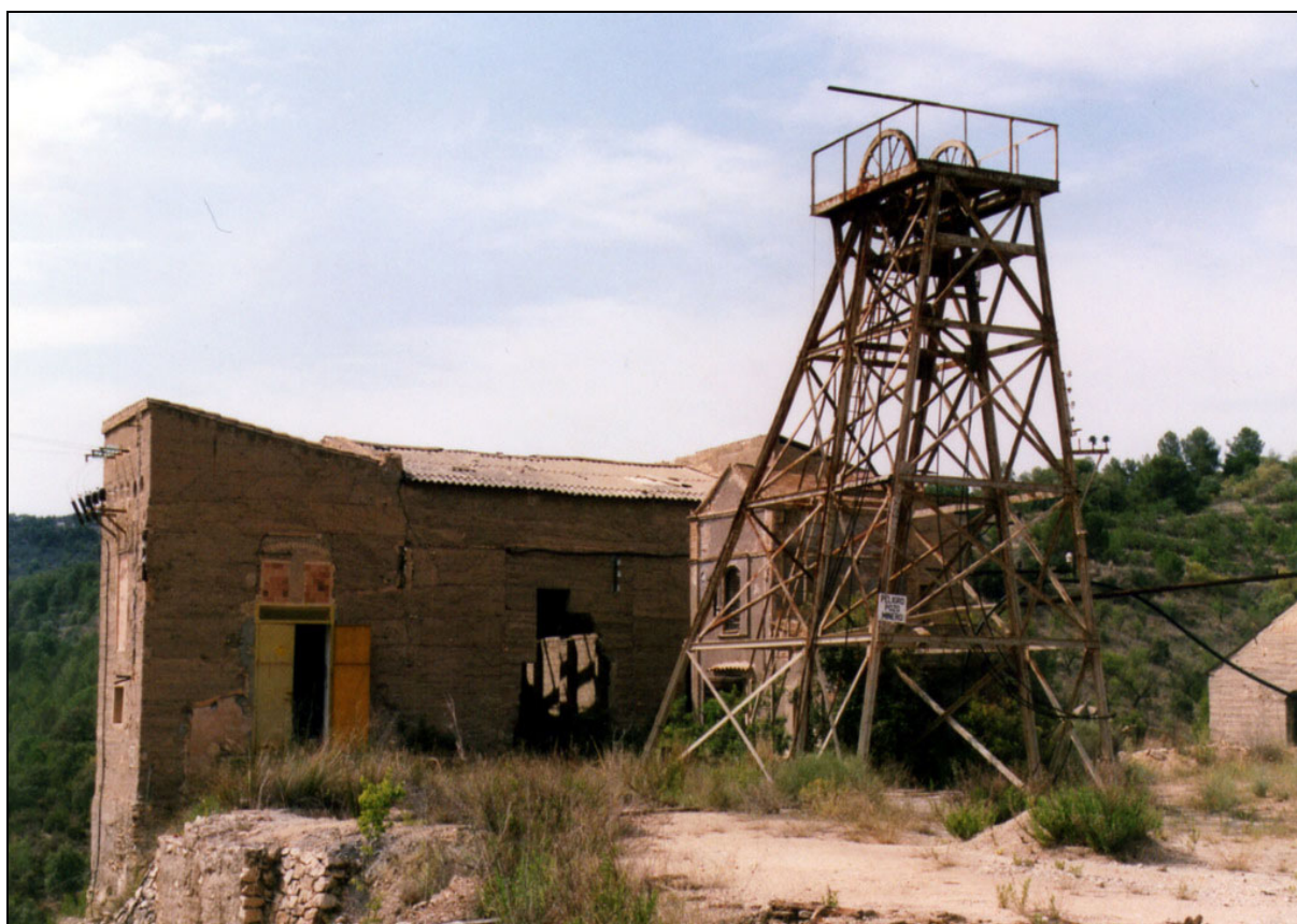
Mina Mineralogía . El Molar, Tarragona

En Lérida también hallamos otra, llamada Zinconisa , que se repetirá de forma idéntica en Tarragona o Cantabria. Algunas minas de hierro adoptaron como nombre el del mineral explotado. Así, localizamos una, nombrada La Oligista , en Lugo, y otra en Cantabria de casi idéntico nombre: Oligisto . En Murcia se encontraba la llamada Carbonato , y en Tarragona una registrada como Mercurio , aunque bien podía tratarse del planeta, del dios del comercio o del líquido metal.