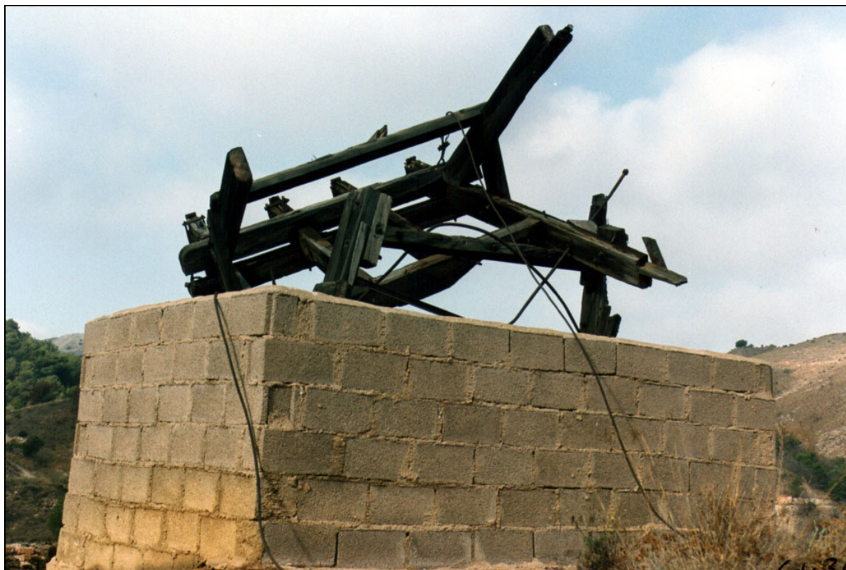
Mina Julio César. Llano del Beal, Murcia

Entre los monarcas, emperadores y Jefes de Estado que se vieron favorecidos por tales designaciones mineras, señalaremos Julio César , Pericles , Felipe II , Reina Victoria , Guillermína II , Eduardo VII , Alfonso XII , Príncipe Alfonso , Bismarck , Trajano , Tiberio , Reina Regente , o los míticos Cleopatra y Marco Antonio . En Asturias, una mina llevó el nombre de Napoleón , en Vizcaya otra ostentó el de Emperatriz Eugenia , y en esta misma provincia hubo una dedicada al gran militar y político italiano Garibaldi . La mina Presidente Kruger fue bautizada así en honor del quinto presidente de África del Sur, Paul Kruger, quien destacó en la guerra de los Boers y cuyo papel fue fundamental para el desarrollo de la minería del oro en el Transvaal, territorio este que igualmente dio nombre a más de una explotación española.