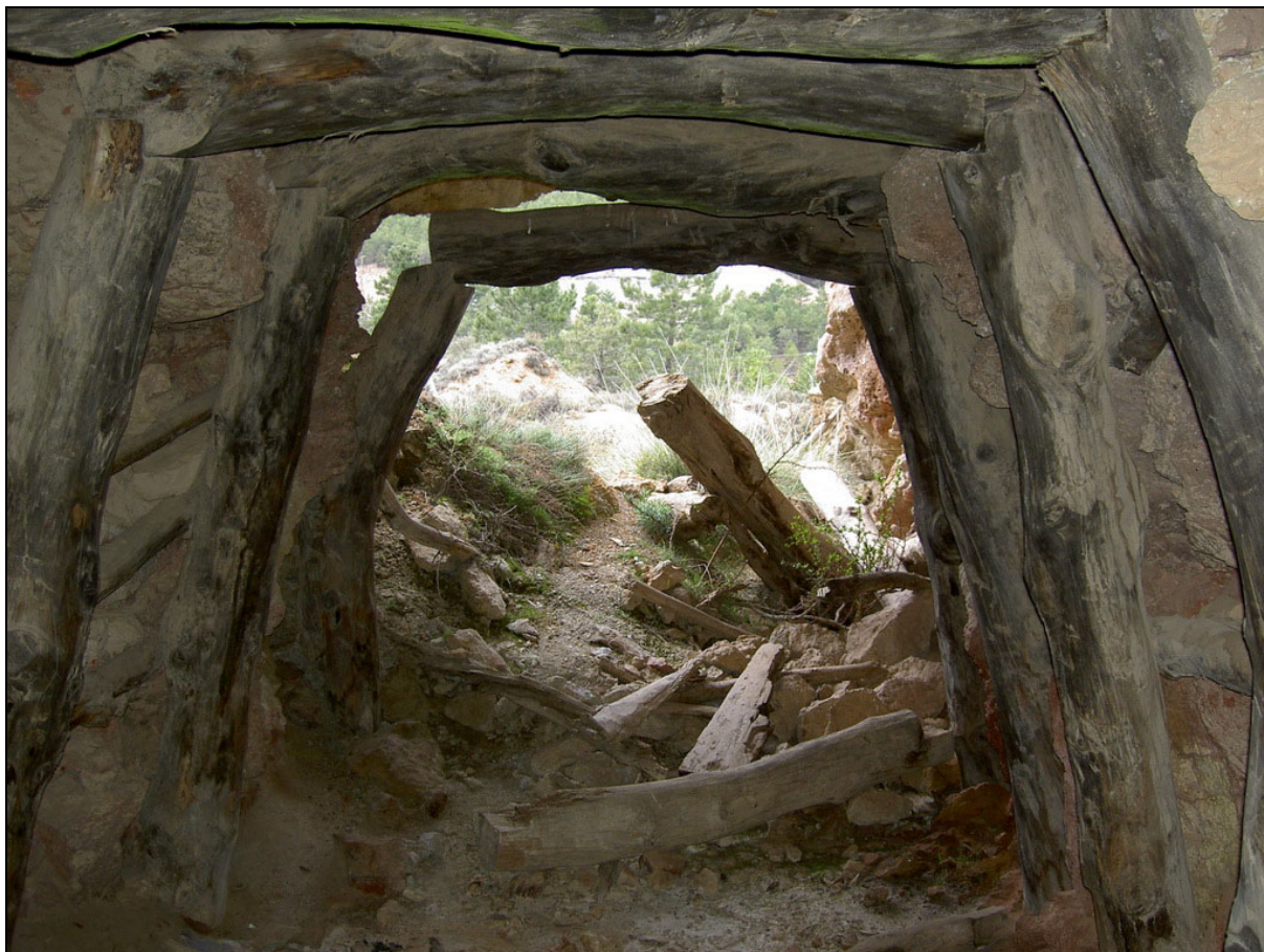
Mina El Telegrama . Serón, Almería