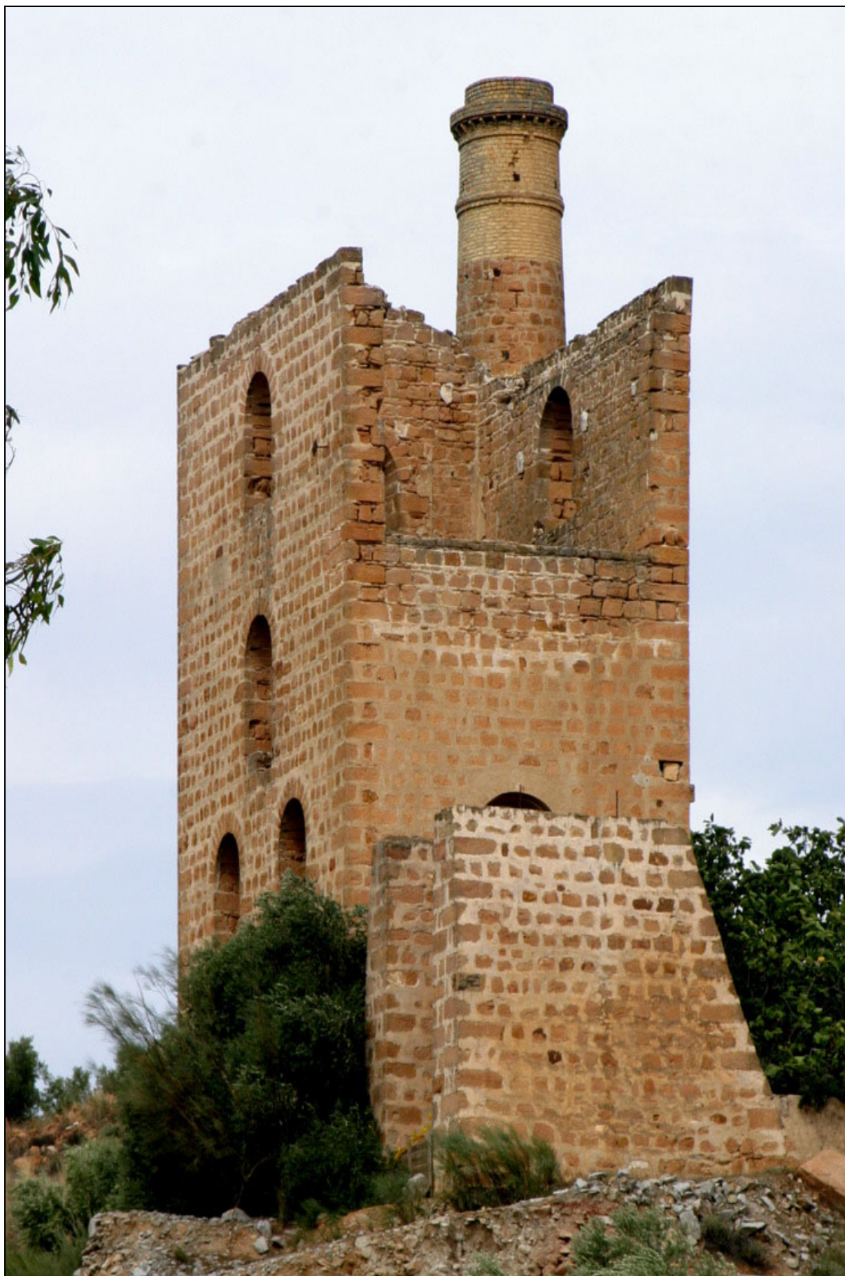
Pozo Barings . Linares, Jaén