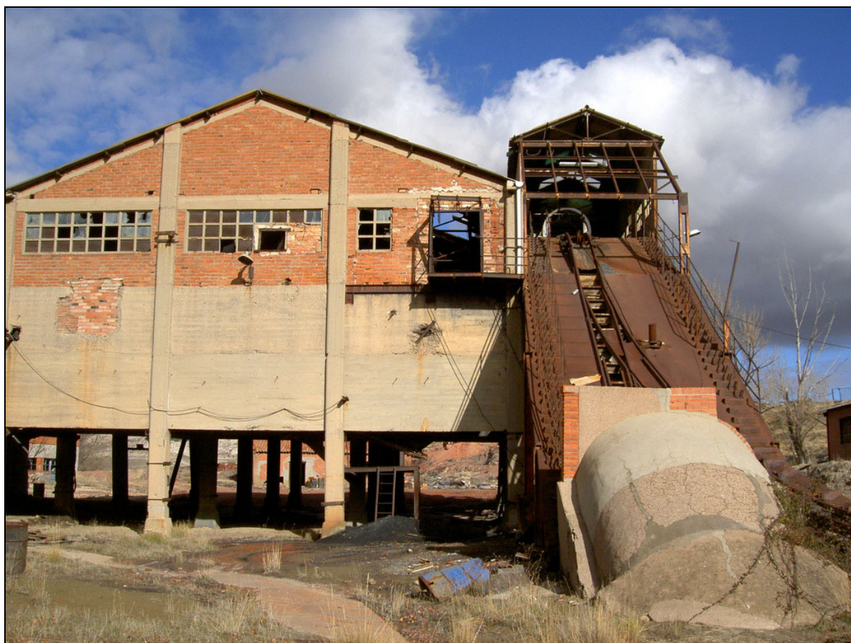
Mina Aún hay caso . Escucha, Teruel