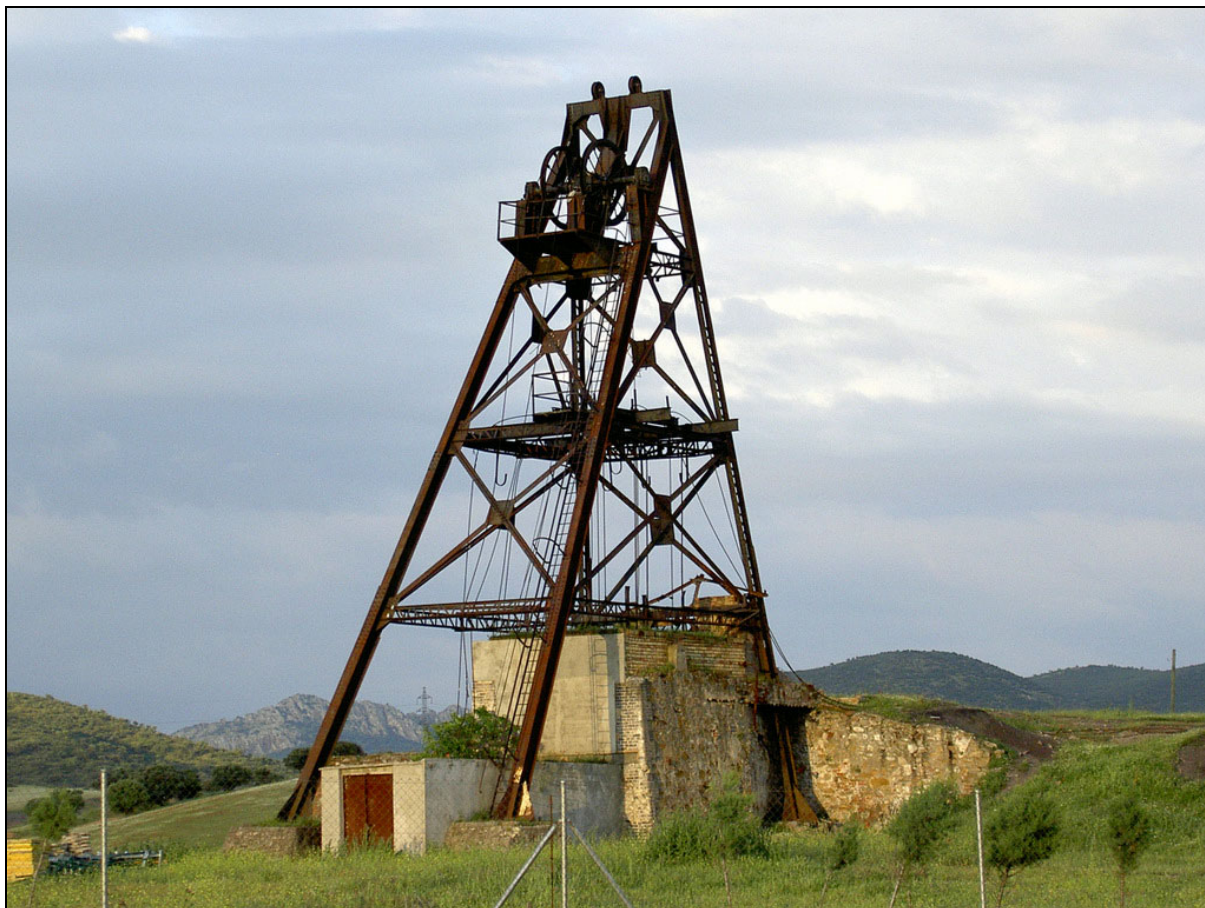
Mina Aurora . Belméz, Córdoba