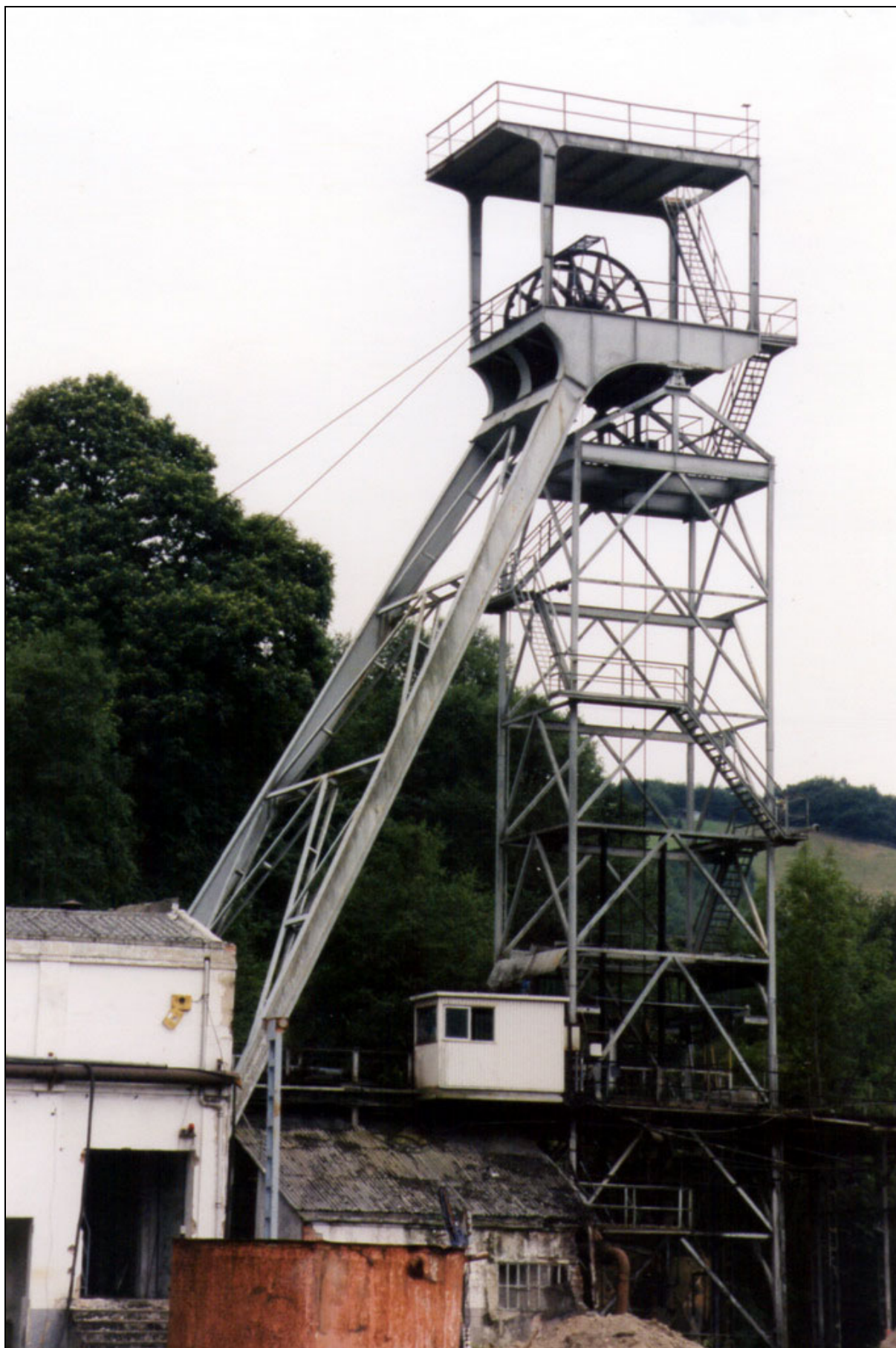
Mina Tres amigos . Rioturbio, Mieres, Asturias