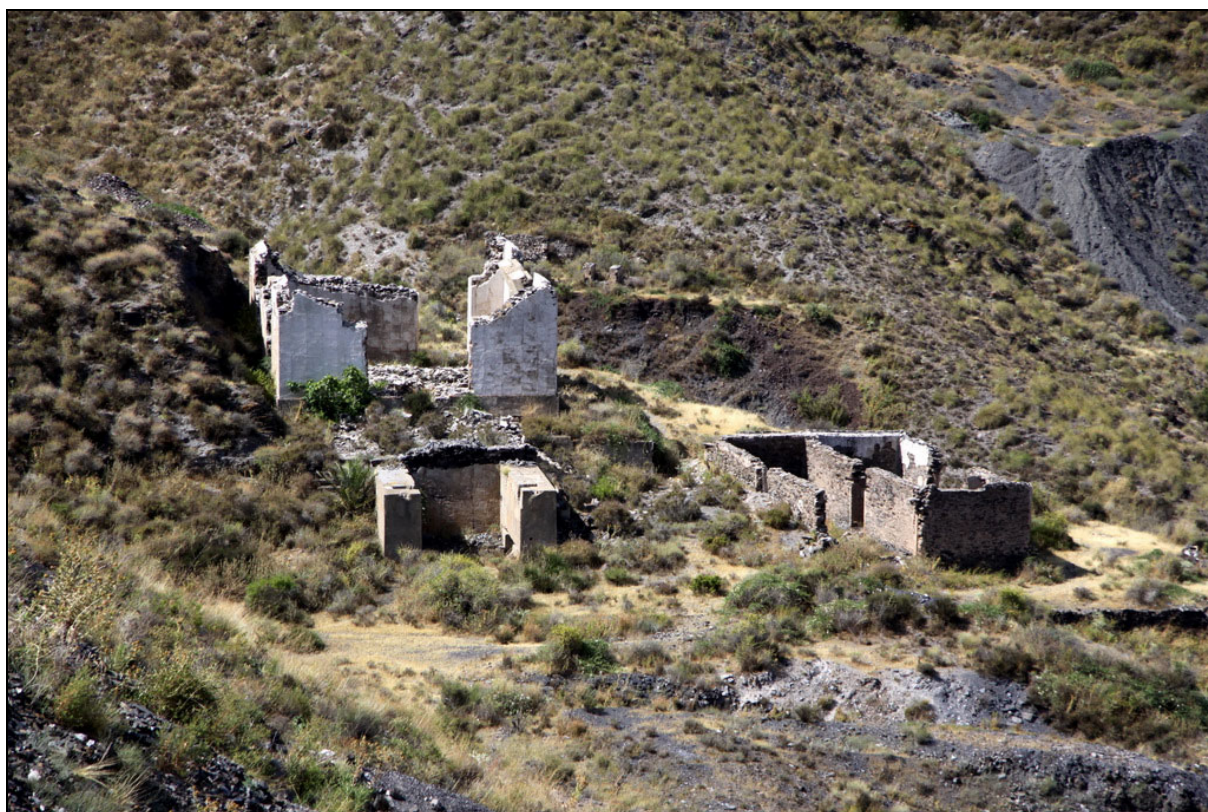
Mina Casta Diva . Cuevas del Almanzora, Almería

Pero como no todo debía ser morboso, recordaremos ahora el bonito nombre impuesto a una mina de Sierra Almagrera: Casta Diva . Que lo cortés no quita lo valiente, y se puede ser diva y casta al mismo tiempo.